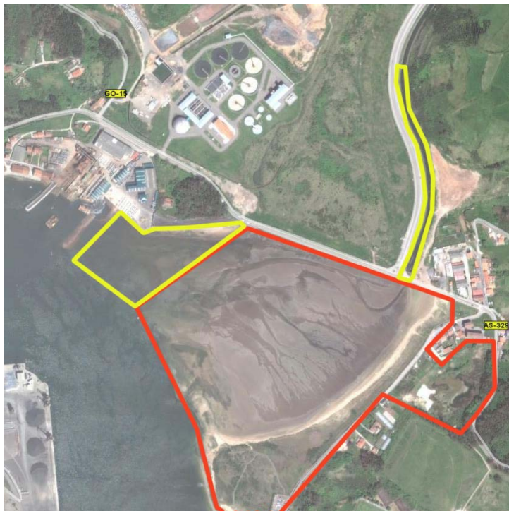
En rojo los límites actuales y en amarillo la propuesta de ampliación.