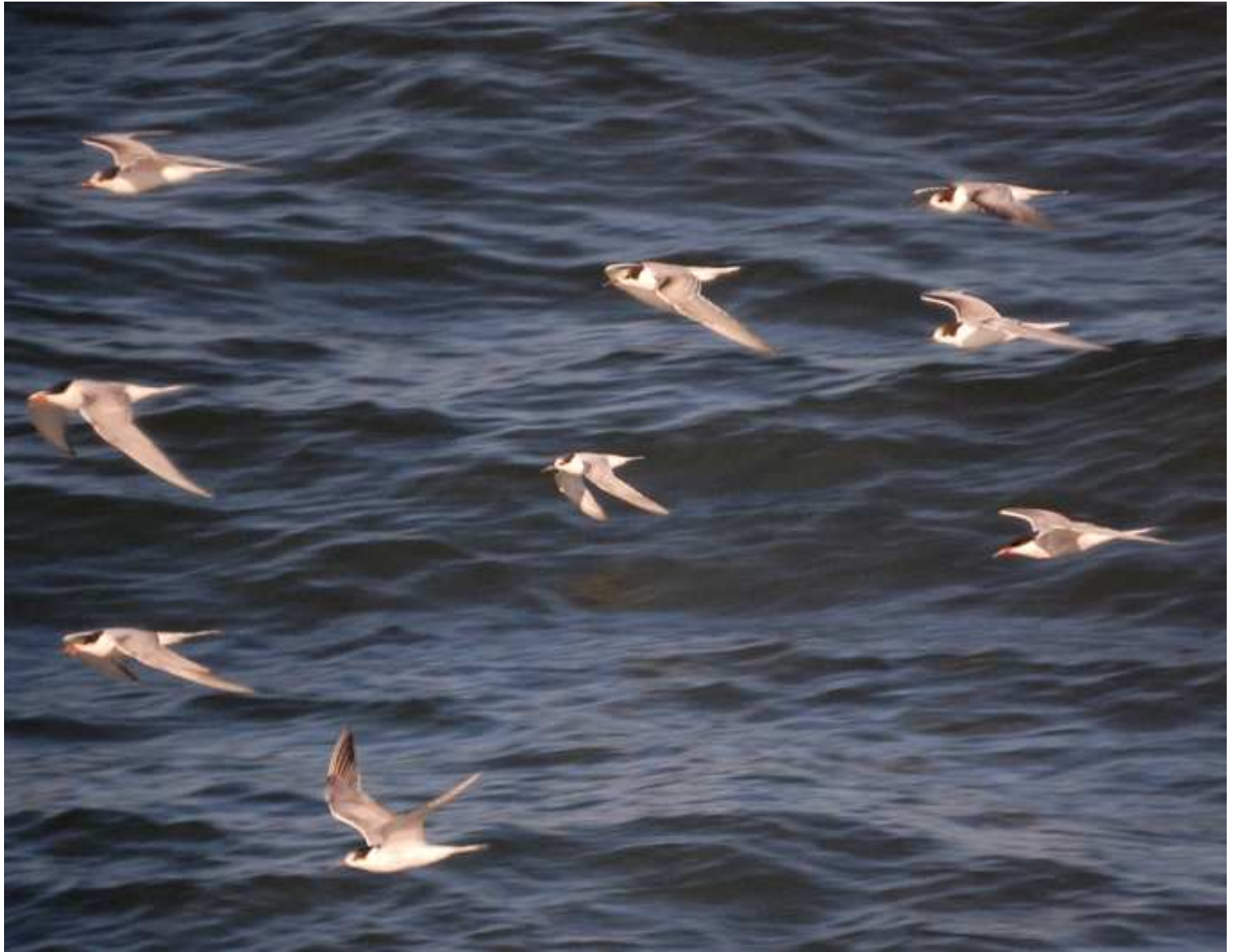
GRUPO DE CHARRANES PASANDO DELANTE DE LA VACA