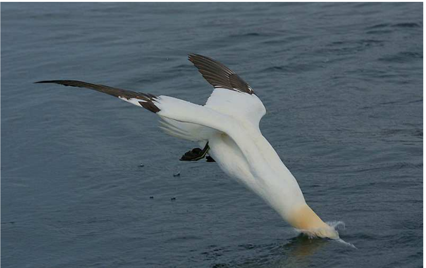
ALCATRACES EN PASO Y PESCANDO DELANTE DE LA VACA